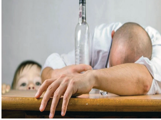
मद्यपी वडील आपल्या मुलाबरोबर