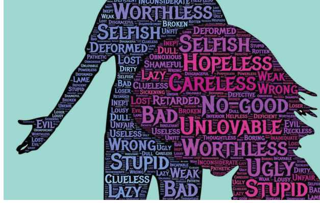
मुलांवरील भावनिक अत्याचार

जेव्हा एखाद्या मुलाची काळजी घेणारा एखादी प्रौढ व्यक्ती मुलाचा सतत अपमान करते, धमकी देते, त्याच्या वागणुकीबद्दल सतत पूर्वग्रहदुषित मते बनवते, अपमान करते किंवा झिडकारते, आणि त्या व्यक्तीकडून मुलाला प्रेम मिळत नाही तेव्हा मुलाला स्वतःविषयी नकारात्मक भावना निर्माण होतात. या भावनिक अत्याचाराचे परिणामही दीर्घकाळपर्यंत शारीरिक अत्याचाराएवढेच गंभीर असू शकतात.