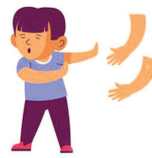
शरीराला स्पर्श केलेला न आवडणे