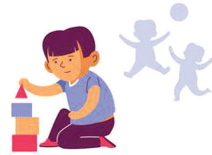
एकटे खेळण्याची प्रवृत्ती