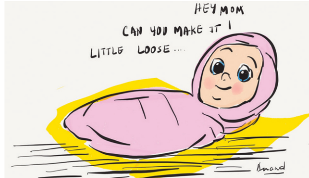
चित्र ३ : बाळाचे गुंडाळणे