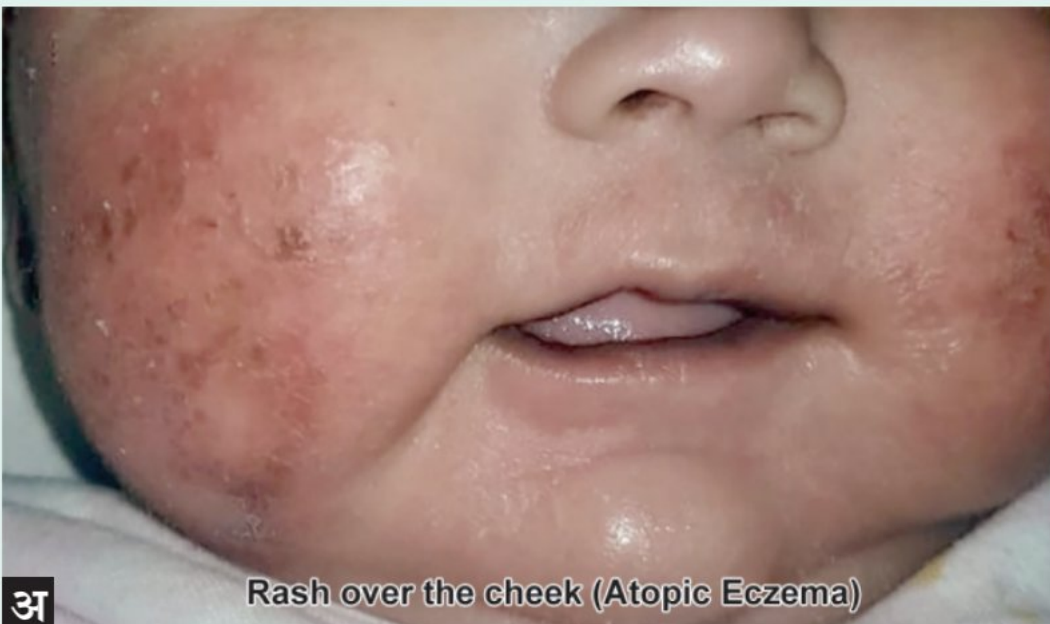
अ Rash over the cheek (Atopic Eczema)

इसब हे बालपणात आढळून येणारे त्वचेच्या अॅलर्जीचे पहिले प्रकटीकरण आहे. काही प्रतिद्रव्यजनक पदार्थांवर (Allergen) तीव्र संवेदना दर्शवणारी स्थिती असू शकते. ज्या मुलांना लहानपणी बालइसब असतो, त्यांना सामान्यतः आयुष्याच्या उत्तरार्धात दमा होतो. या प्रक्रियेला (Atopic March) म्हणतात. या मुलांची त्वचा कोरडी आणि भेगाळलेली असते. (आकृती क्र. १ अ व ब) यामुळे त्वचेमधून धूळ, सूक्ष्म कीटक (mite) परागकण अन्नकण वगैरे शरीरात प्रवेश करतात आणि या पदार्थांबाबत संवेदनाक्षम होण्याची शक्यता वाढवतात यामुळे अॅलर्जीसंबंधी पुढील अनेक प्रक्रिया घडून येतात. (allergic cascade) जर कुटुंबातील सदस्यांमध्ये काही प्रकारच्या अॅलर्जीचा इतिहास असेल तर मुलाला दम्याचा विकार होण्याची शक्यता वाढते. परंतु या मुलावर योग्यप्रकारे उपचार करून त्याच्या त्वचेच्या इसबाचा योग्य इलाज केला तर त्याच्या पुढे होणाऱ्या दम्याच्या विकाराची तीव्रता कमी करता येते.