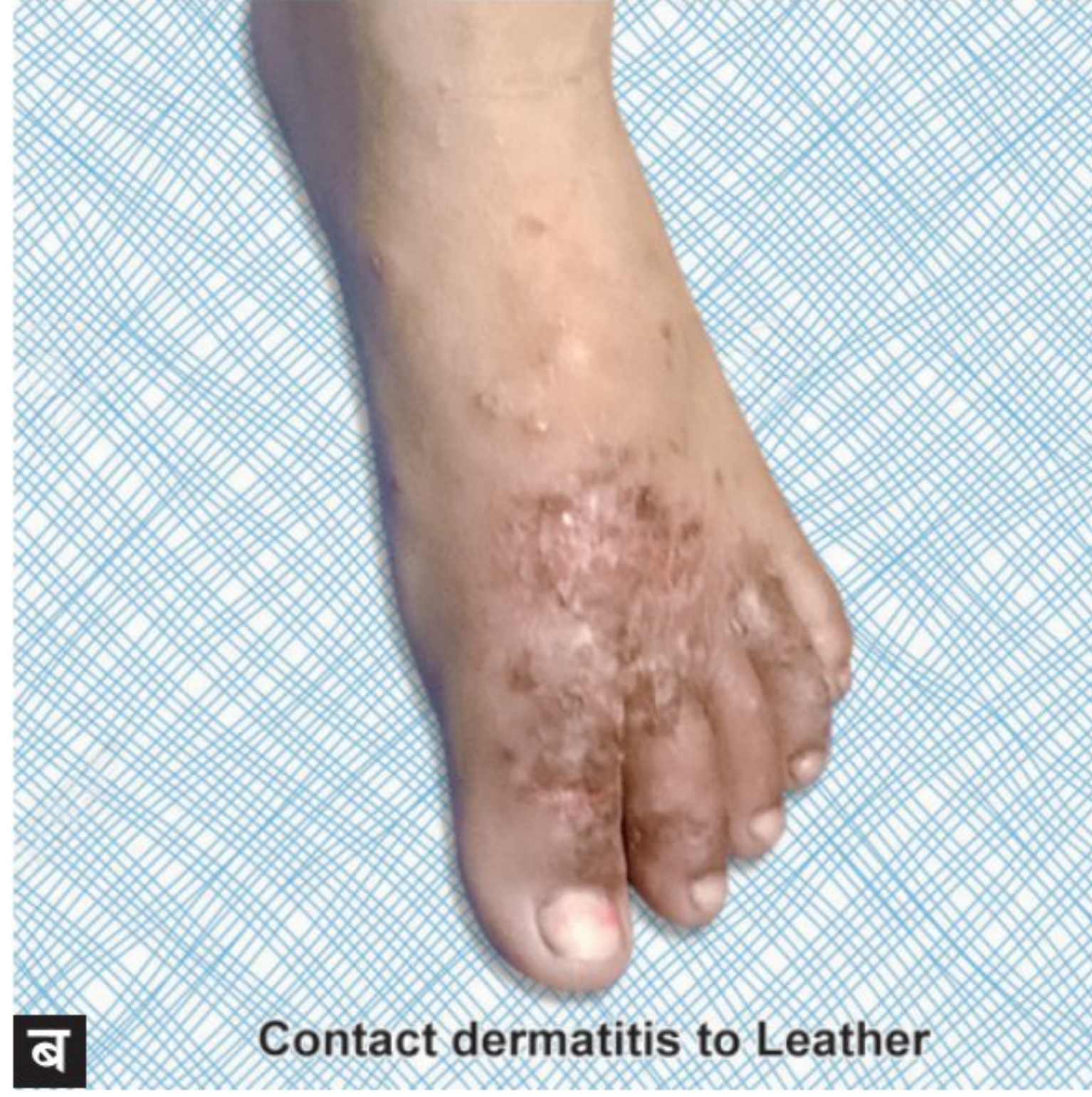
ब Contact dermatitis to Leather

आकृती क्र. ३ अ आणि ब चांदी आणि चामड्यामुळे झालेला त्वचारोग)