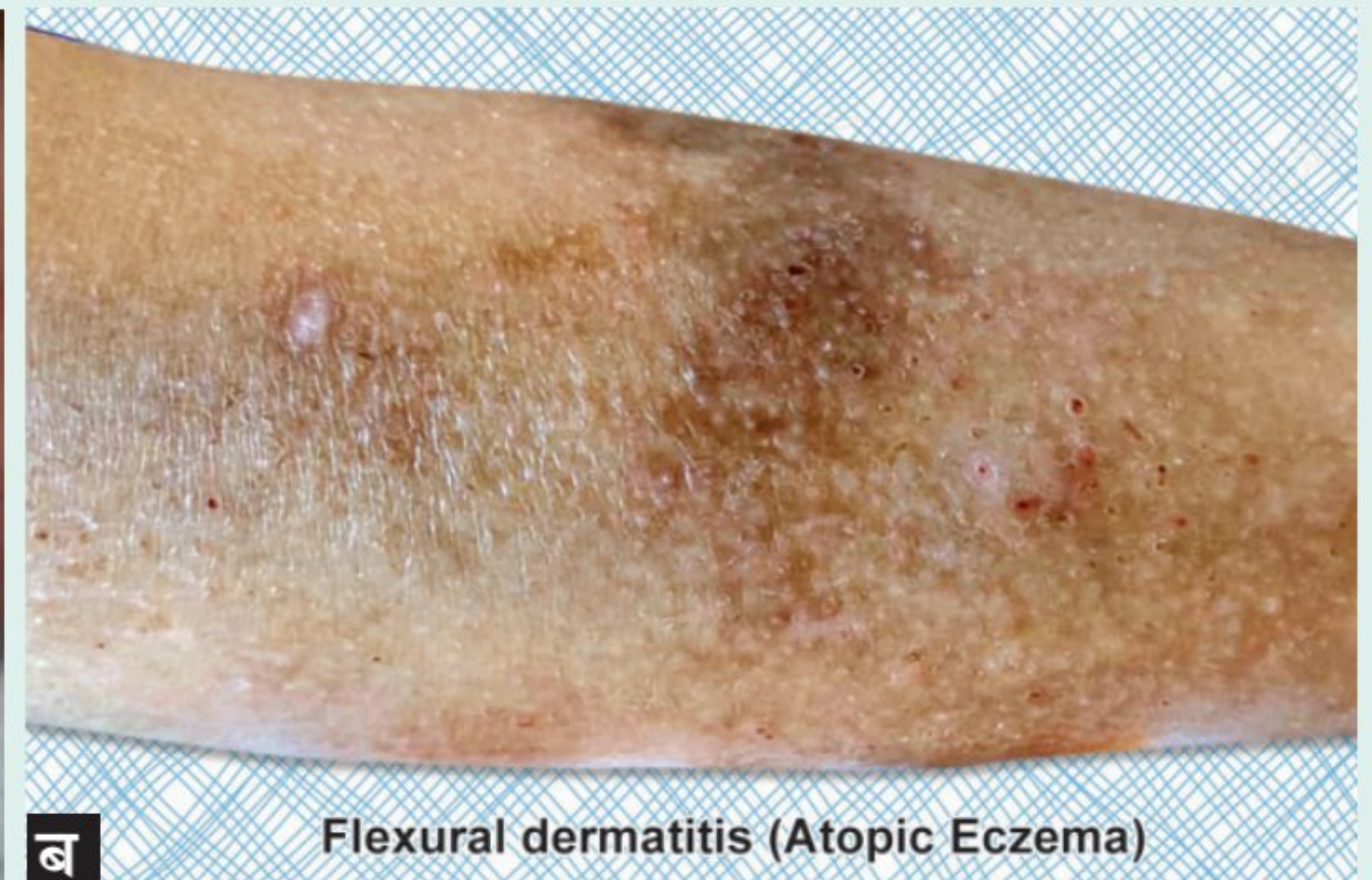
ब Flexural dermatitis (Atopic Eczema)