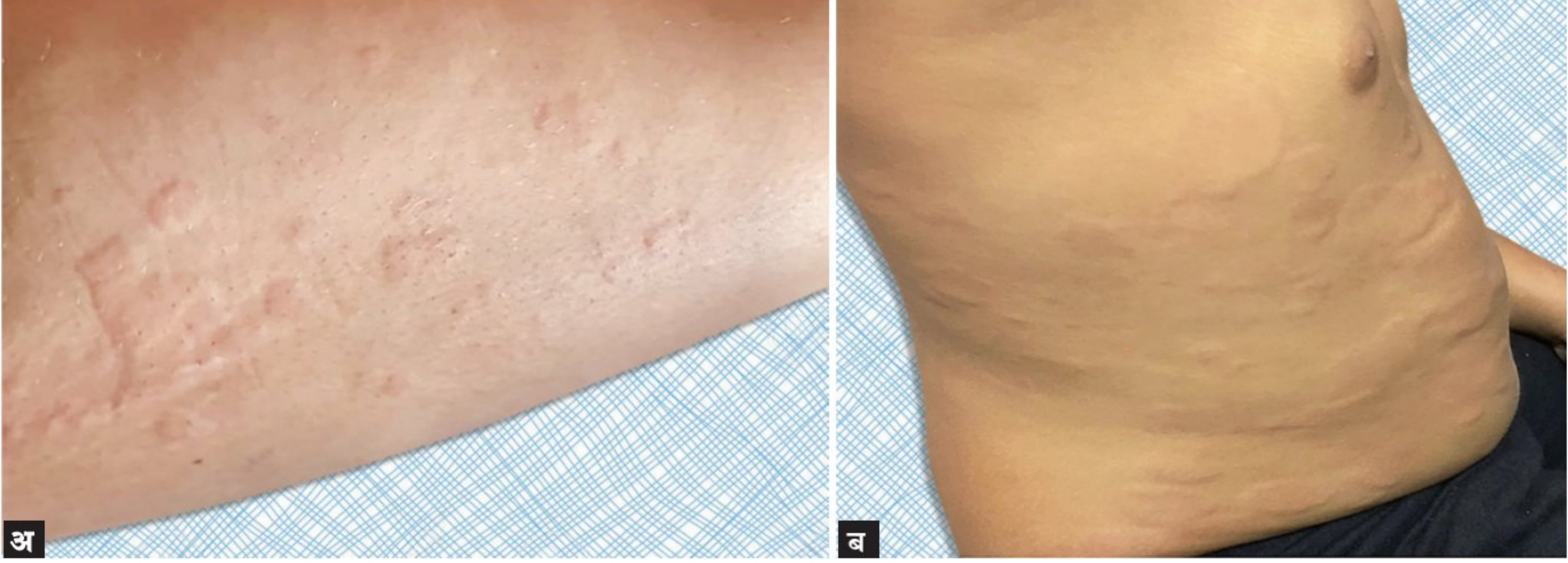
आकृती क्र. २अ आणि ब त्वचेवर उसळलेले पित्त (दादड किंवा गांधी) (urticarial rash)