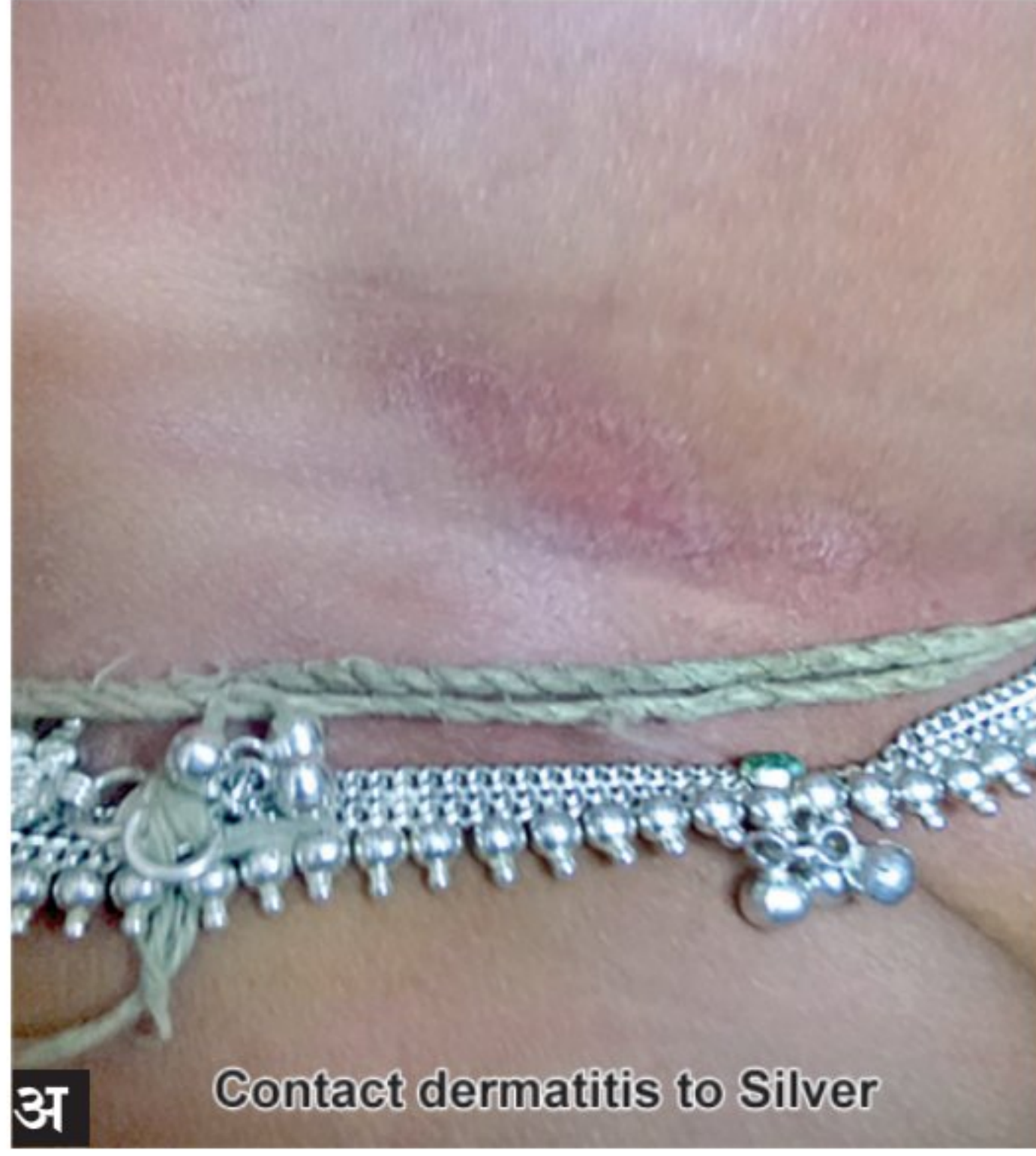
अ Contact dermatitis to Silver

जेव्हा एवाद्या व्यक्तीला क्षोभकारक (irritant) पदार्थाशी संपर्क आल्यास किंवा त्याला त्या पदार्थाची अॅलर्जी आहे अशा पदार्थाशी संपर्क आल्यास लाल गांधी उठतात आणि तिकडच्या त्वचेचे पापुद्रे निघतात, त्या स्थितीला संपर्क त्वचारोग असे म्हणतात. (आकृती ३ अ आणि ब व आकृती बंद आराखडा [Flowchart])