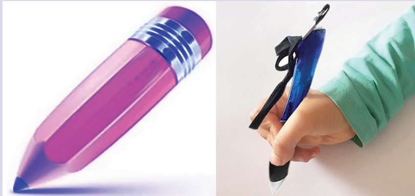
चित्र २ : लड्डू पेन्सिल किंवा पेन

जी आय ए ह्या संधिवातात येणारे व्यंग हे जे आय एचा कुठला उपप्रकार आहे यावर अवलंबून आहे. सर्व शरीरावर परिणाम करणारी आणि अनेक सांध्यांना परिणाम करणारी जे आय ए याचा शरीरावर जास्त परिणाम होतो. ओलिंगो आर्टिक्युलर म्हणजे कमी सांधेसूज जाणाऱ्या याचा परिणाम जास्त होत नाही. अंदाजे तीस टक्के मुलांना ज्यांना इन्धेसायटीस रिलेटेड आर्थराइटिस आहे त्यांना पाठीच्या कण्याच्या त्रासाचा अनुभव येतो आणि चाळीस ते पन्नास टक्के मुले मोठी होत असताना त्यांना हा त्रास पुढे चालू राहू शकतो. त्यातल्या काही जणांना पाच टक्क्यांपेक्षा कमी सांधे बदलण्याची किंवा सांधे प्रत्यारोपणाची गरजही पडू शकते. जी आय मध्ये होणारा मृत्यू दर हा एक टक्क्यापेक्षा कमी आहे आणि तो मुख्यत्वे करून काही जीवघेण्या गुंतागुंती उदाहरणार्थ MACROPHAGE ACTIVATION SYNDROME किंवा स्टेरोइड वापरामुळे होणारा जंतुसंसर्ग हे आहेत. मात्र अतिशय परिणामकारक औषधउपचार पद्धती, बायोलॉजिकल आणि अतिशय बारीक लक्ष ठेवून केलेल्या उपचारांमुळे दूरगामी परिणामांचा विचार करता जी आय एस साठी चित्र आशादायक आहे