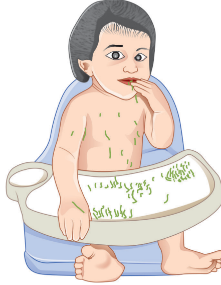
आकृती ३ : बाळाच्या कलाने दिलेला पूरक आहार