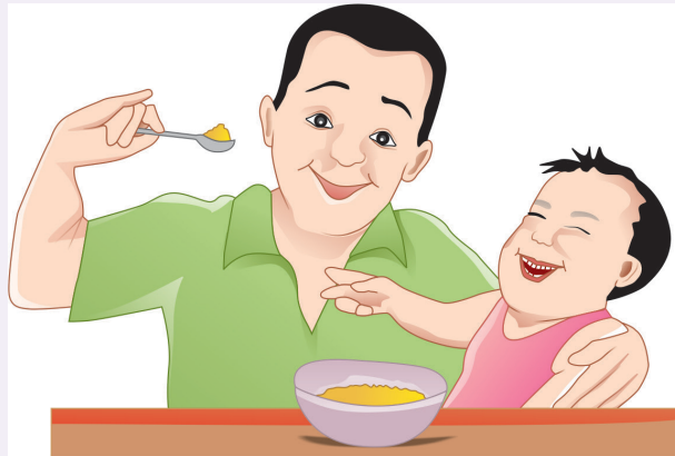
चित्र ५ : प्रतिसादात्मक आहाराचा सराव करा