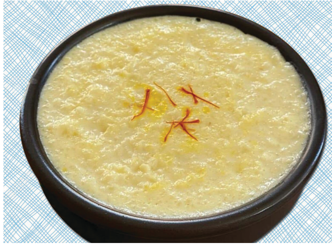
आकृती २ : खीर हे संतुलित आहाराचे एक उदाहरण आहे