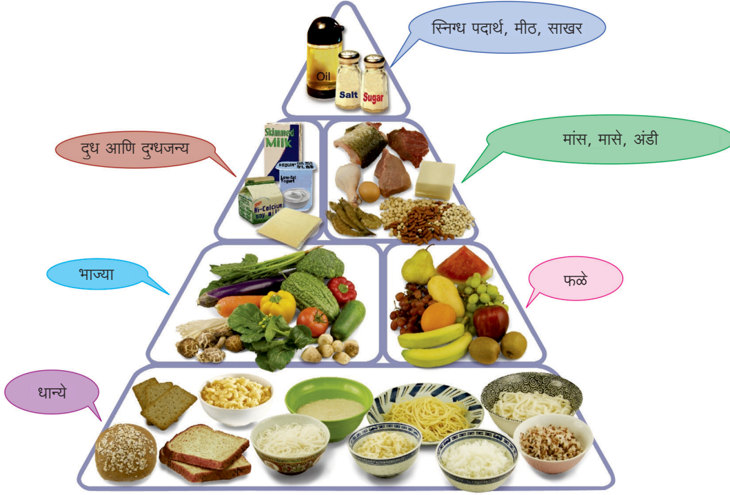
आकृती १ : यांच्या मिश्रणाने संतुलित अन्न बनते.