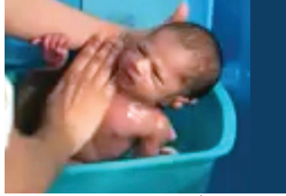
चित्र ५ : चित्रात नवजात बाळाला आंघोळ घालतांना दिसत आहे.