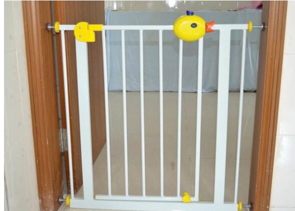
चित्र १० : बाळाच्या खोलीत पाळीव प्राण्यांचा प्रवेश प्रतिबंध करण्यासाठी हे गेटाचे चित्र आहे.

कुत्र्यांना बाळाच्या खोलीत प्रवेश न करण्याचे प्रशिक्षण दिले जाऊ शकते. लहान कुत्र्यांसाठी खोलीच्या प्रवेशद्वारावरील बेबी गेट आणि पायऱ्यांचा आधार उपयुक्त आहे. तुम्ही अल्ट्रासोनिक साऊंड बॅरीयर देखील वापरू शकता. केसाळ पाळीव प्राणी असेल तर गळलेल्या केसांची काळजी घ्या.