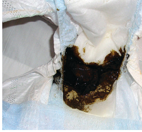
चित्र २: डावीकडील चित्रात नवजात बाळाची पहिली शी मेकॉनियम आहे.