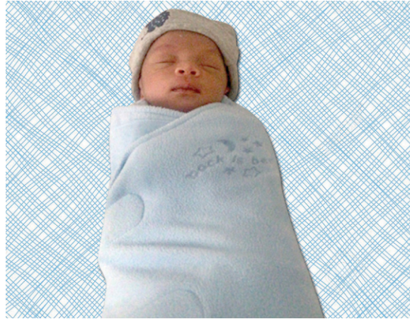
चित्र ४ : हे नवजात बाळासाठी त्याच्या पाठीवर, कोणत्याही उशीशिवाय, सैल कपडे किंवा पलंग नसलेला सुरक्षित झोपेचे स्थिती दाखवते.

सुरुवातीला काही दिवसात झोपेचे कोणतेही निश्चित वेळापत्रक नसते. साधारणपणे नवजात बालक दिवसाला सुमारे ८ ते ९ तास आणि रात्री ८ तास झोपू शकते. बाळ दिवसा आणि रात्री दोन्ही मध्ये दर ४० मिनिटांनी जागे होतात आणि हलतात. दर २ ते ३ तासांनी त्यांना लक्षपूर्वक दूध पाजणे आवश्यक आहे. तुम्ही तुमच्या बाळाला झोपेची लक्षणे ओळखून झोपण्यास मदत करू शकता. (उदा. जांभई येणे, चिडचिड करणे, रडण किंवा शांत होणे) आणि सुरक्षित आणि आरामदायी झोपेसाठी योग्य वातावरण निर्माण केले पाहिजे. (चित्र ४)