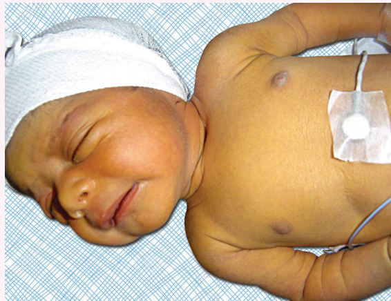
आकृती २ : कावीळ