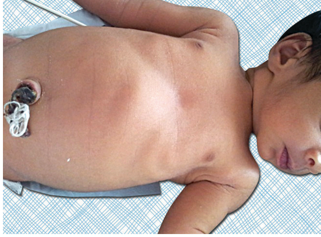
आकृती ८ : छाती आत खेचली जाते