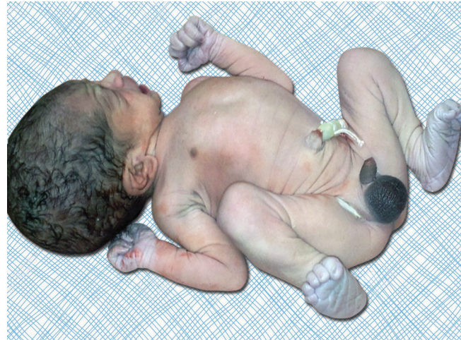
आकृती ३ : crocyanosis. हाताचे व पायाचे तळवे निळसर आहेत परंतु ओठ गुलाबी आहेत.