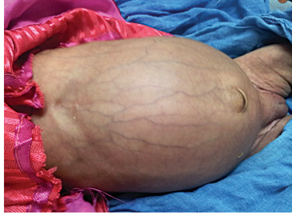
आकृती ५ : पोट फुगलेल्या अवस्थेत