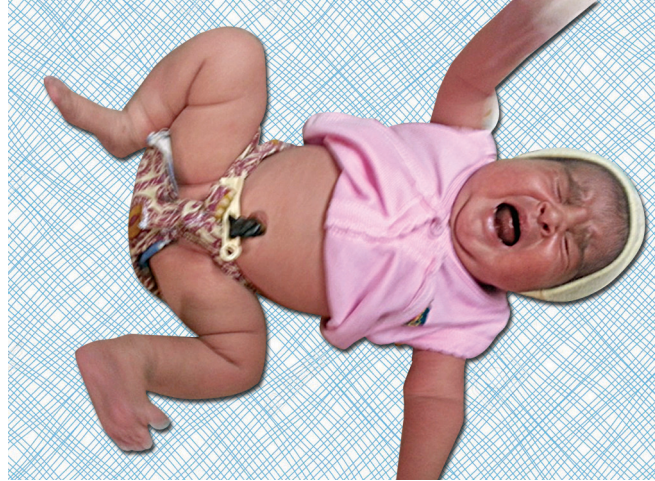
आकृती ९ : खूप कळवळून रडणारे बाळ