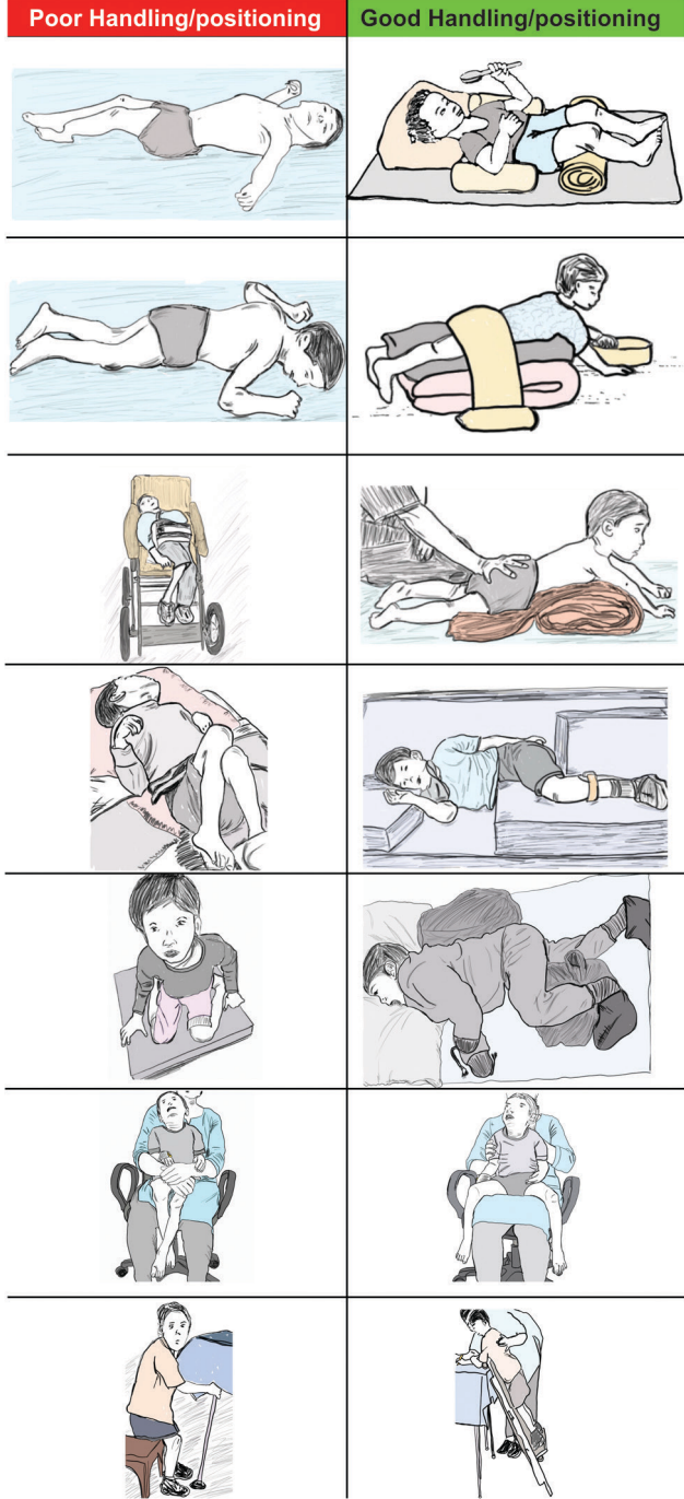
चित्र ५ : मेंदूचा पक्षाघात असलेल्या मुलाला कसे हाताळावे व त्याची पोझिशन कशी असावी हे दर्शविले आहे.