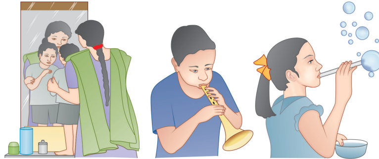
चित्र ३ : लाल गळणे कमी करण्याकरता वापरण्यात येणाऱ्या मुखपद्धती.