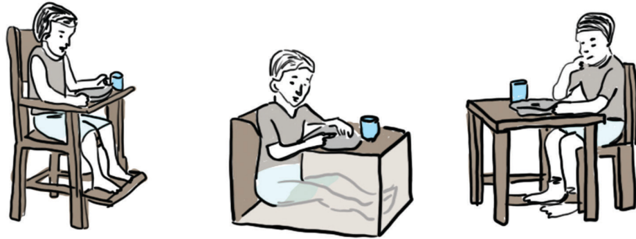
चित्र २ : जेवताना निरनिराळ्या पद्धतींचा अवलंब केला जाऊ शकतो