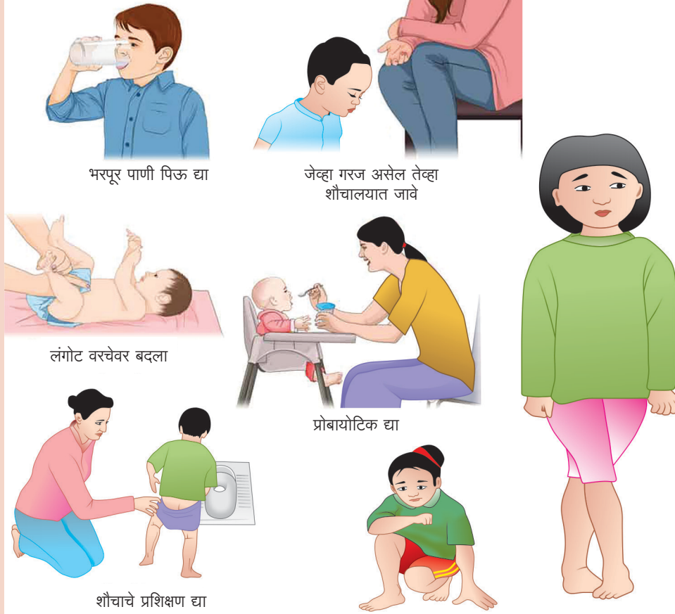
चित्र ३ : मुलांमध्ये मूत्रमार्गाचा संसर्ग टाळणे