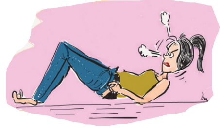
चित्र ५ : घट्ट जीन्स घालण्याचे दुष्परिणाम