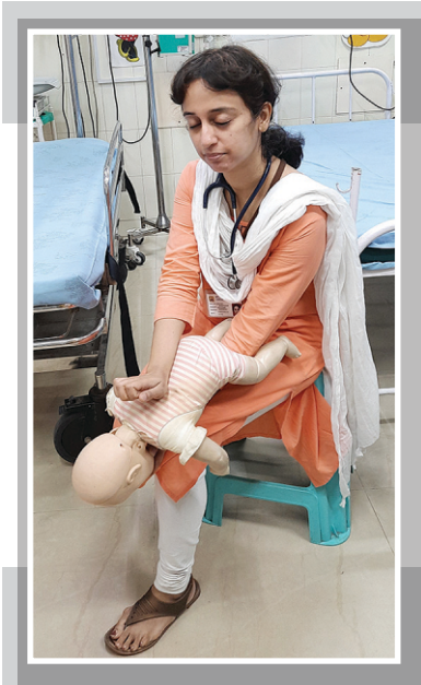
आकृती ७ घशात अडकलेली गोष्ट काढण्याकरता पाठीवर फटके