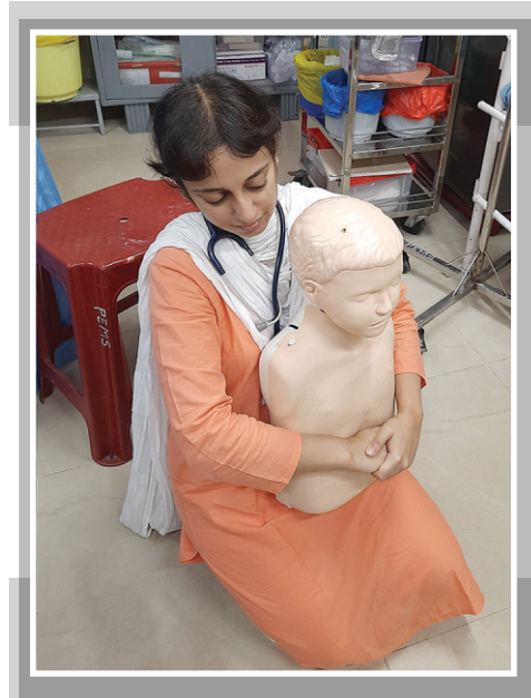
आकृती ९ हेम्लिक युक्ती वा क्रिया