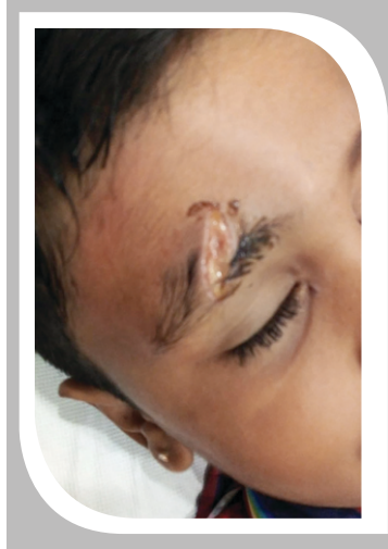
आकृती १ वरवरची जखम