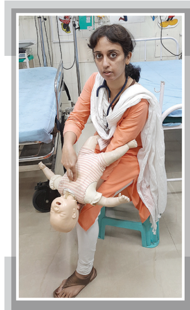
आकृती ८ घशात अडकलेली गोष्ट काढण्याकरता छातीला दिलेले झटके