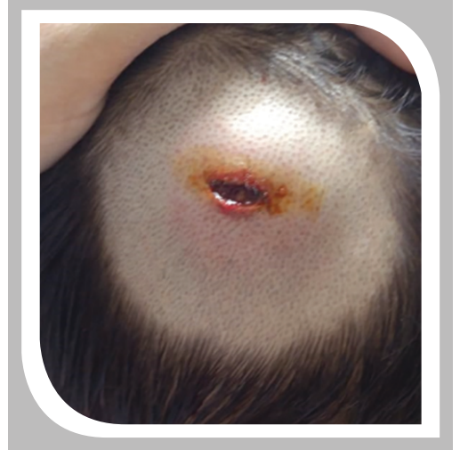
आकृती २ खोल जखम