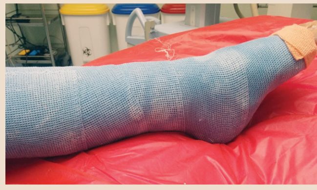
आकृती ४ प्लॅस्टर मध्ये असलेला हाड मोडलेला पाय

अ) अशावेळी बरेचदा एक विशिष्ट आवाज ऐकू येतो किंवा कटकन वाजते.